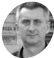
Свеморавски Песнички Витез