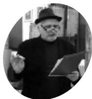
Топлички Књижевни Устаник

Песници госте Буцине кафане чаште турама – песама. После пете поетске туре подвлачи се црта. О звањима одлучују гости код Џамбаског бора: мегданције освајају звање песничког војводе, песничког делибоше и песничког девера 2016.