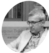
Ставилац Јадарски И Бан Дрински